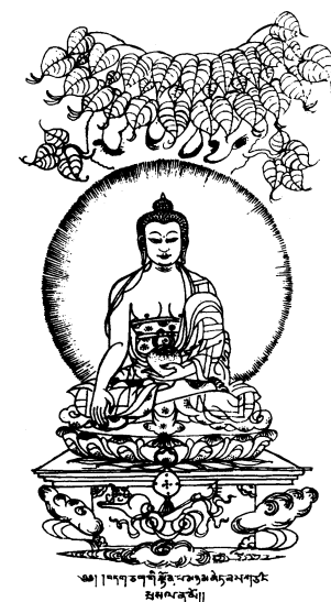
Phật Thích Ca Mâu Ni Lama Zopa Rinpoche phát họa

Tựa đề tiếng Anh: The Noble Mahayana Sanghata sutra Dharma-Paryaya